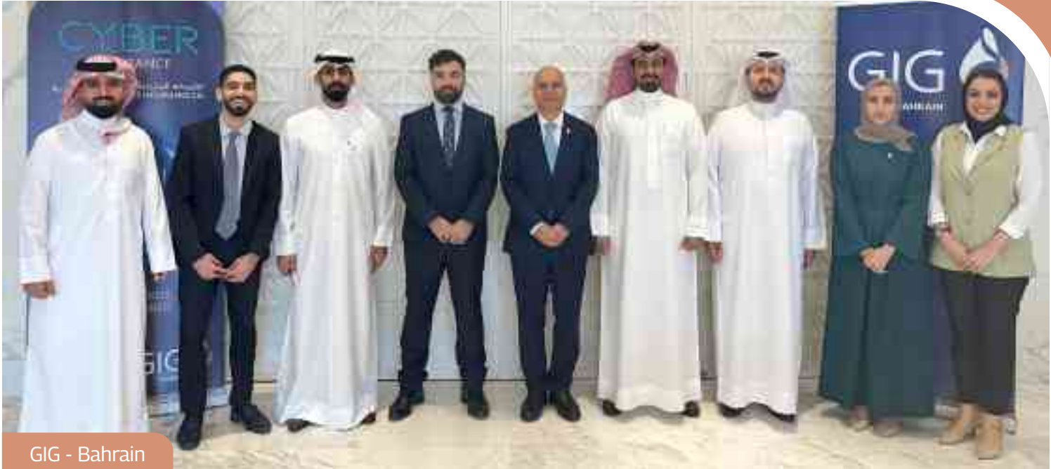
GIG - Bahrain

نظمت ورشة عمل تدريبية بعنوان «تأمين الأمن السيبراني»