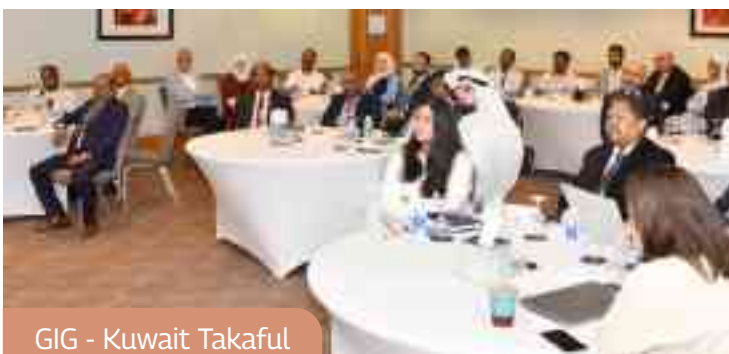
GIG - Kuwait Takaful

التأمين الذي يمتاز بخبرة عالية ومتخصص في تطوير الأعمال من بيزلي - لندن و هو أحد رواد معاهدة إعادة التأمين السيبراني.