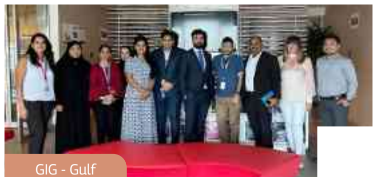
GIG - Gulf